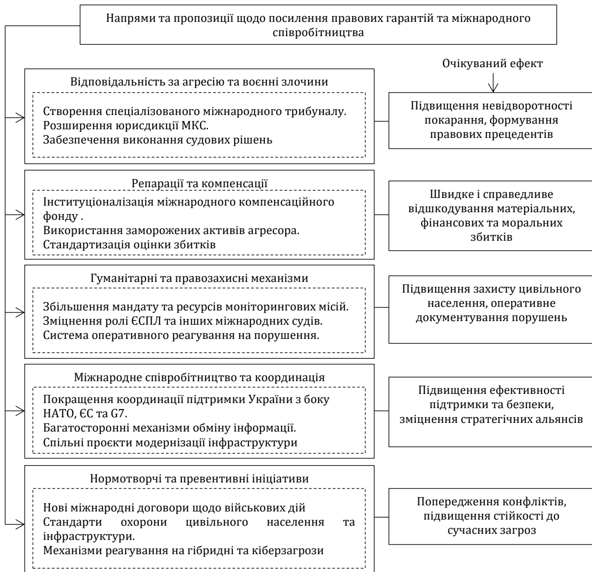
Рис.1. Пропозиції щодо посилення правових гарантій та міжнародного співробітництва

порушених прав – на практиці воно формує міцний інституційний фундамент, здатний стримувати потенційні акти агресії та підвищувати результативність міжнародно-правових механізмів.