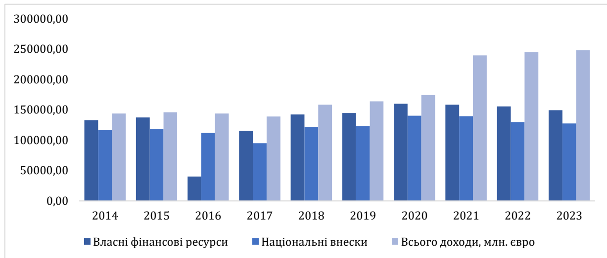
Рис. 2. Динаміка обсягів власних фінансових ресурсів та національних внесків бюджету ЄС у 2014–2023 роках, млн. євро

бюджету ЄС, пошуку нових інструментів, джерел фінансування, незважаючи на стабільність у зростанні надходжень та національних внесків до бюджету ЄС у 2014–2023 роках (рис. 2).