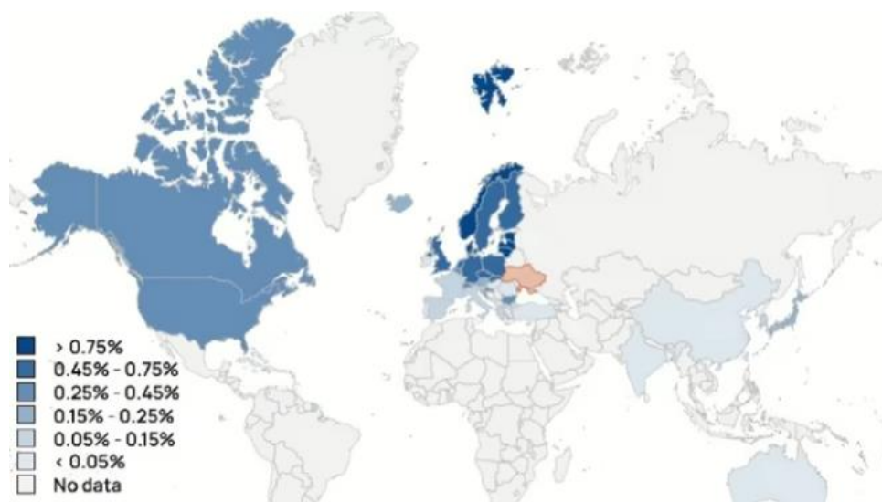
Рис. 2. Допомога Україні у відсотках до ВВП

Нинішню ситуацію в ЄС, пов'язану з різким зростанням споживчих цін та значним відставанням темпів зростання зарплат від темпів інфляції, експерти вже назвали європейською «кризою вартості життя» (Cost-of-living crisis). Проте як показують розрахунки Центру моніторингу процесів конвергенції в ЄС (EU Convergence Monitoring Hub), що функціонує при Європейському фонді для покращення умов життя та праці (Єврофонд), за останні десятиліття Євросоюз досяг висхідної конвергенції – покращення показників країн – членів ЄС поряд із скороченням відмінностей між ними як в економічному, так і в соціальному вимірах. Почати рух у цьому напрямі Україні доцільно із втілення рекомендацій Міжнародних асоціацій, згідно яких Україні насамперед необхідно визначити власне бачення бажаних змін у процесі євроінтеграції, сформулювати відповідні критерії та з'ясувати, які підходи політики ЄС (і загалом країн розвинуеного Заходу) можуть виявитися найбільш доцільними для цього [15]. Формулювання національного бачення бажаних соціальних змін та його інституційне втілення мають бути в числі перших завдань післявоєнної політики України, орієнтованої на забезпечення якості життя [16]. Практика багатьох країн доказує, що саме економічна безпека є необхідною, хоча й недостатньою, враховуючи інституційні, демографічні, екологічні та інші аспекти, умовою забезпечення соціальної якості життя. Європі доведеться подвоїти поточний рівень і темпи допомоги Україні в 2024 році (рис. 2).