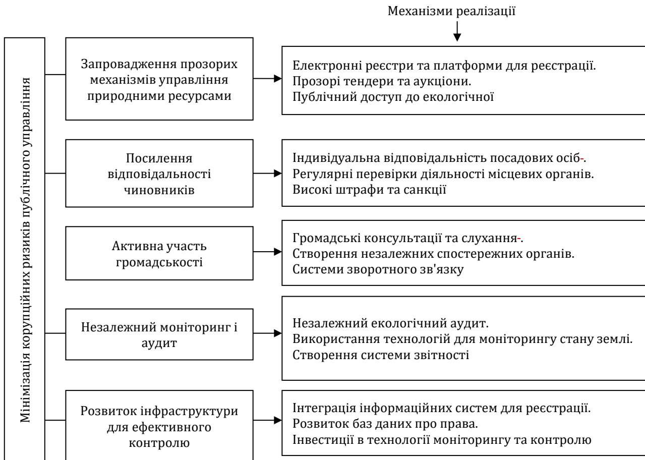
Рис. 3. Мінімізація корупційних ризиків публічного управління в сільській місцевості