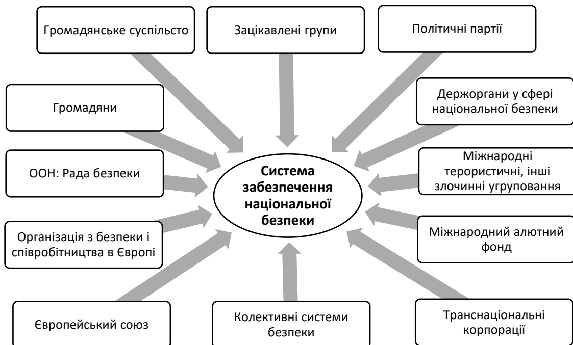
Рис. 2. Зовнішні та внутрішні суб'єкти забезпечення національної безпеки

Падіння Берлінської стіни, розпуск Організації Варшавського Договору і розпад Радянського Союзу призвели до кардинальної зміни стратегічної ситуації в Європі та загалом у Євро-Атлантичному регіоні. Це вимагало зміни, що існувала протягом сорока п'яти років європейської архітектури безпеки. Світ у XXI столітті не безпечний. Зростає конфліктність міжнародних відносин, що призводить до посилення напруженості у всьому глобальному просторі. Геополітичне протистояння між великими центрами сили у нинішніх реаліях має більшою мірою інформаційний характер. Традиційні воєнні дії, акти агресії та диверсій переміщені у медійне поле. Нескінченний потік інформації, генерований соціальними мережами