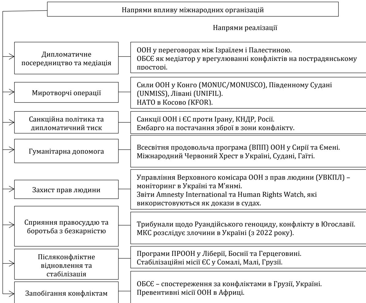
Рис.2. Основні напрями впливу міжнародних організацій

Аналіз основних напрямів впливу міжнародних організацій дозволяє краще зрозуміти, як саме функціонує міжнародна спільнота у розв'язанні конфліктів, котрі інструменти є найефективнішими та в яких випадках їх застосування є критично необхідним. Саме це дослідження скероване на глибше розкриття ролі міжнародних організацій як чинника миру та безпеки у XXI сторіччі. Міжнародні організації використовують широкий спектр інструментів для впливу на перебіг і врегулювання конфліктів. Їхні дії спрямовані як на уникнення ескалації, так і на зменшення наслідків вже наявних збройних зіткнень (рис.2).