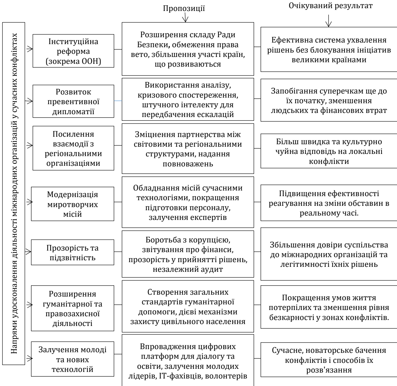
Рис.3. Удосконалення діяльності міжнародних організацій у сучасних конфліктах

світі, займаючись широким спектром діяльності: від посередництва в мирних переговорах до миротворчих місій, санкцій, гуманітарної допомоги та моніторингу прав людини.