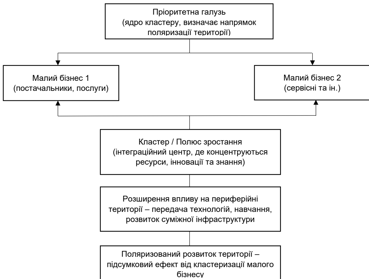
Рис. 2. Механізми формування поляризованого розвитку за участю кластерів малого підприємництва