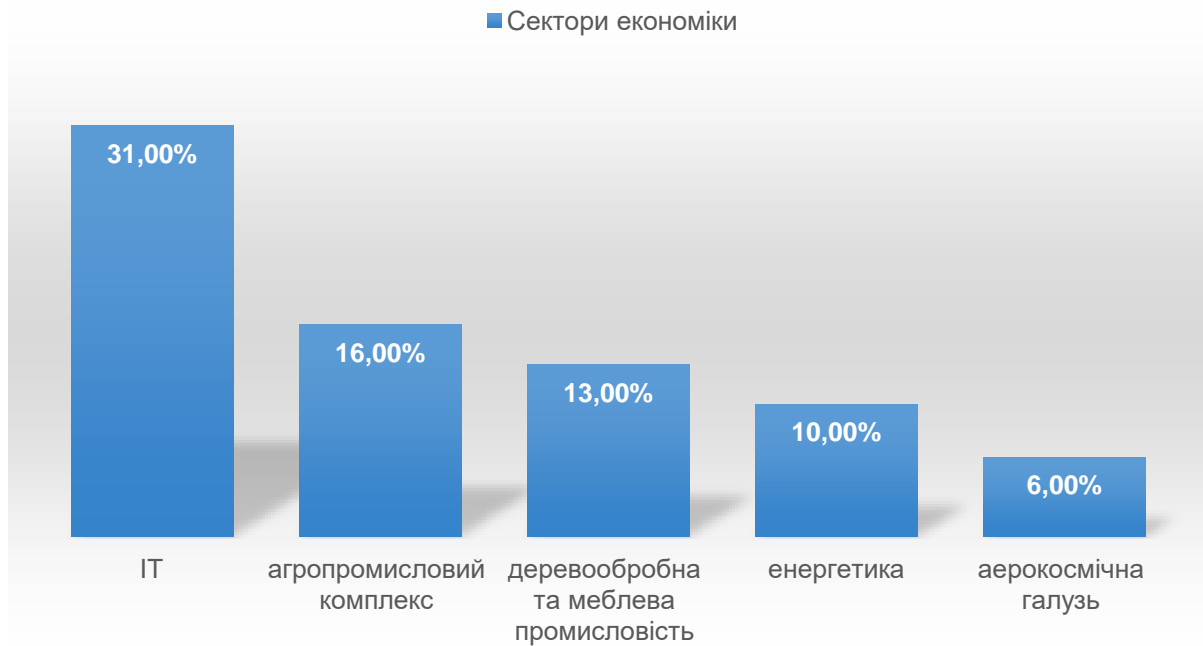
Рис. 3. Структура українських кластерів за секторами економіки, %